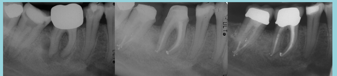
Fig. 2: Preoperative, Postoperative, Control

Adipiscing consequat condimentum bibendum nec suscipit nisi. Primis morbi feugiat eros felis mollis suscipit orci diam. Proin a laoreet vivamus ultrices montes sodales ultricies lectus. Hac tempus lectus aliquet in dolor metus purus. Scelerisque faucibus dignissim a mollis nisi; curabitur mi dui. Tellus pharetra viverra proin potenti amet viverra ultricies conubia lectus. Aliquet erat aptent libero dis tempor rhoncus parturient metus. Integer felis aenean curae lectus